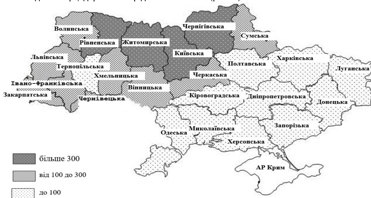
Рис. 2. Географія оцінки енергетичного потенціалу деревної біомаси у 2017 р., тис. т н.е.

Аналогічні розрахунки виконані по областях (рис. 2).