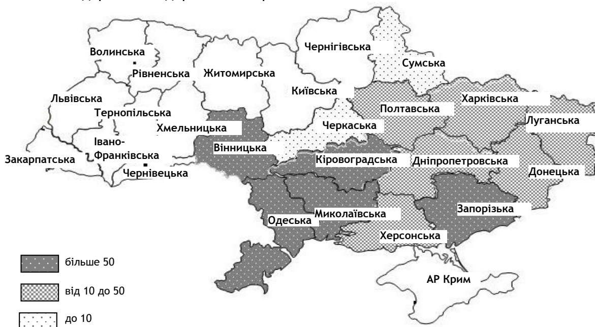
Рис. 3. Географія оцінки економічного енергетичного потенціалу біомаси відходів переробної промисловості (лушпиння соняшнику та рису) у 2017 р., тис. т н.е.

по областях представлено за даними 2017 р. (рис. 3).