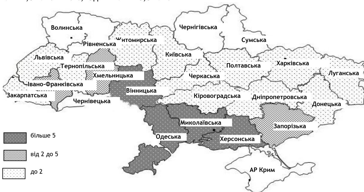
Рис. 1. Географія економічного енергетичного потенціалу деревини з обрізків плодових дерев та виноградників в Україні у 2017 р., тис. т н.е.

н.е. та Херсонській - 3,4 тис. т н.е. областях. Це пояснюється географічним розташуванням згаданих областей та сприятливими кліматичними умовами для вирощування виноградників і плодових дерев.