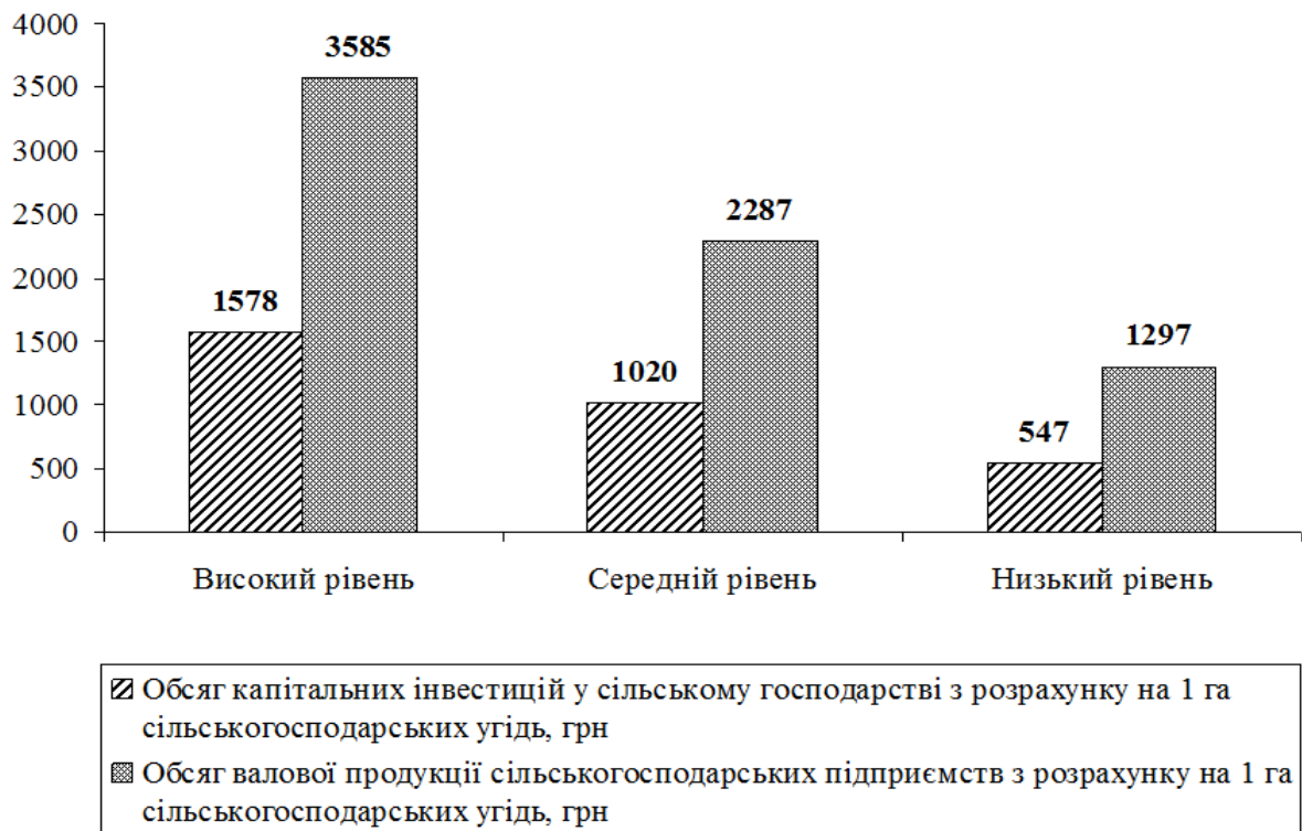
Рис. 3. Розподіл сільськогосподарських підприємств за обсягом капітальних інвестицій та рівнем виробництва, 2017 р.