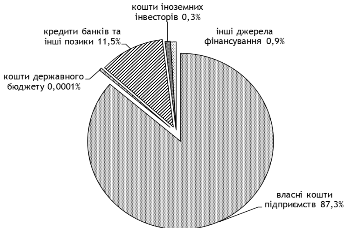
Рис. 1. Джерела фінансування капітальних інвестицій у сільському, лісовому та рибному господарстві, 2017 р.