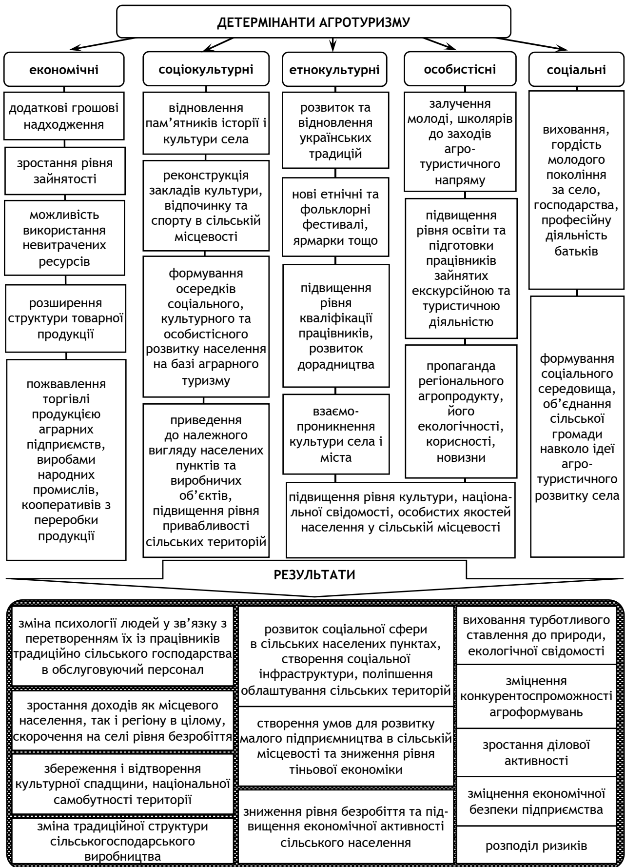
Рис. 1. Соціально-економічні детермінанти розвитку агротуризму