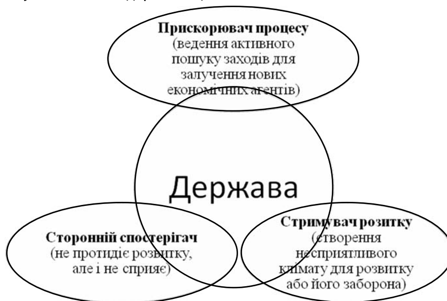
Рис. 3. Роль держави як регулятора підприємницького процесу

Вважаємо за необхідне зазначити і роль держави у контексті регулювання процесу підприємництва, яку, залежно від конкретної ситуації, можна розглядати як прискорювача підприємницького процесу та його стороннього спостерігача, так і стримувача розвитку підприємництва (рис. 3) [5].