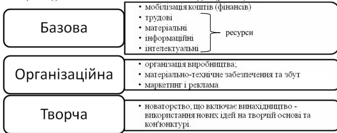
Рис. 1. Основи підприємницької діяльності за С. В. Мочерним

С. В. Мочерний [18], підприємництво ґрунтується на базовій, організаційній і творчій засадах (рис. 1).