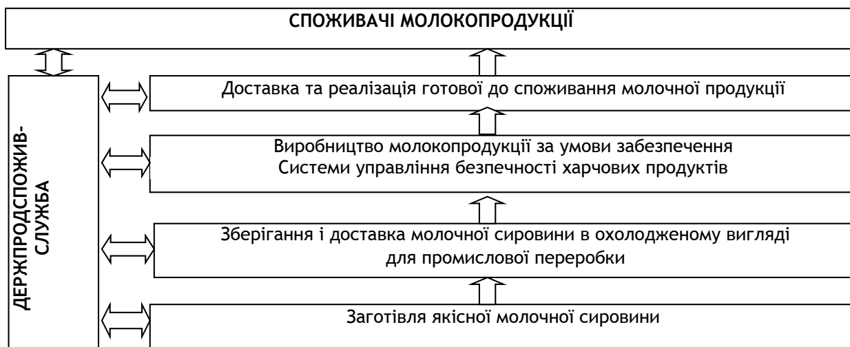
Рис. 1. Виробничий цикл для молокопродукції відповідно до НАССР

робкою документації та наведенням елементарного порядку на виробництві. Важливо, щоб усі учасники виробничого процесу - від закупівлі молочної сировини до кінцевого споживача були свідомі, діяли прозоро і відповідально. Контроль за виконанням даних міжнародних стандартів якості покладено на Держпродспоживслужбу, яка відтепер контролює ветеринарні та фітосанітарні заходи у регіонах держави, є своєрідним містком для підтримання інтересів споживачів і виробників, перевіряє дотримання санітарно-епідеміологічних норм на виробництві та ціни на готову молокопродукцію [7]. Кожний учасник ринку, в тому числі і споживачі, відповідно до нових законодавчих актів, з цього моменту мають право вимагати від Держпродспоживслужби здійснення перевірки діяльності іншого учасника (оператора) ринку, проведення лабораторно-клінічних досліджень його продукції відповідно до нормативів сертифіката. У свою чергу молочні підприємства несуть відповідальність за виготовлення якісної та безпечної для здоров'я нації молокопродукції на всіх етапах виробничого циклу: заготівля молочної сировини - зберігання і доставка сировини в охолодженому вигляді на місце промислової переробки - виробництво молокопродукції - доставка і реалізація готової до споживання молочної продукції - споживач (рис. 1).