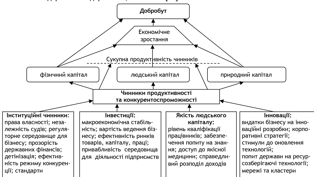
Рис. 2. Модель економічного зростання через взаємозв'язок між чинниками продуктивності, конкурентоспроможності

Ряд учених-аграрників під поняттям конкурентоспроможності аграрних підприємств розуміють здатність суб'єктів економічної діяльності аграрної сфери пристосовуватися до нових умов господарювання, використовувати свої конкурентні переваги і перемагати в конкурентній боротьбі на ринках сільськогосподарської продукції/послуг та засобів виробництва, максимально ефективно використовувати земельні ресурси, якомога повніше задовольняти потреби покупця шляхом аналізу структури ринку і гнучкості реагування на зміну його кон'юнктури [12].