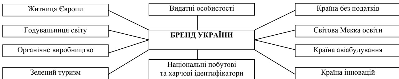
Рис. 1. Варіанти та напрями національного брендингу