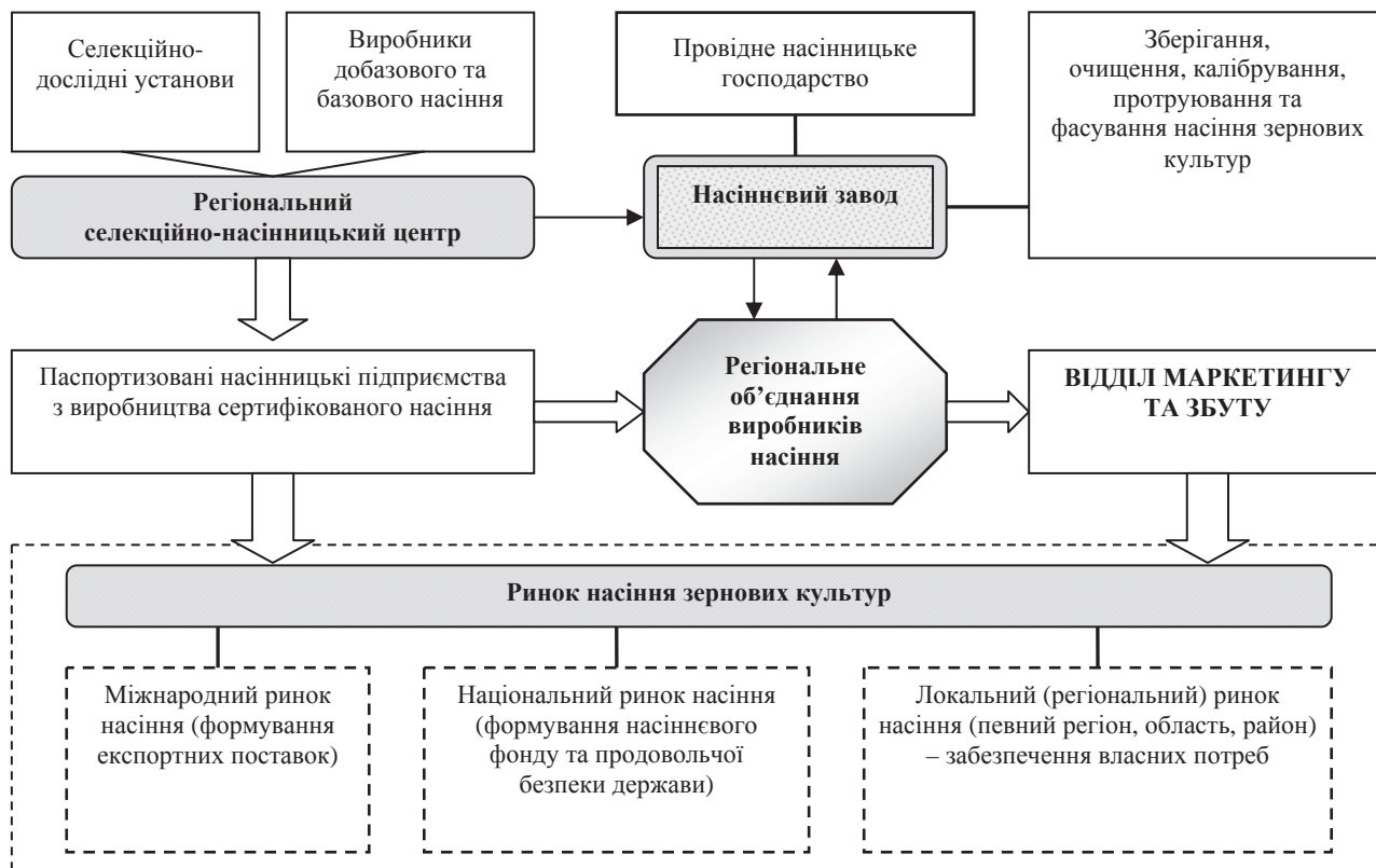
Рис. 2. Удосконалення організаційно-виробничої структури системи насінництва зернових культур в Україні