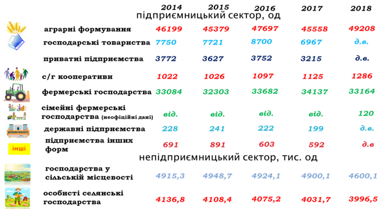
Рис. 1. Становлення сімейного фермерства як особливого господарського укладу господарських формувань в аграрному секторі економіки України

потрібно вести мову про мікро- і малі селянські господарства; фермерські класичні - набули певної динаміки розвитку протягом більш як двох десятиліть, становлення сімейного фермерства як особливого господарського укладу, здатного за певних умов забезпечити ефективний розвиток сільських територій (рис. 1).