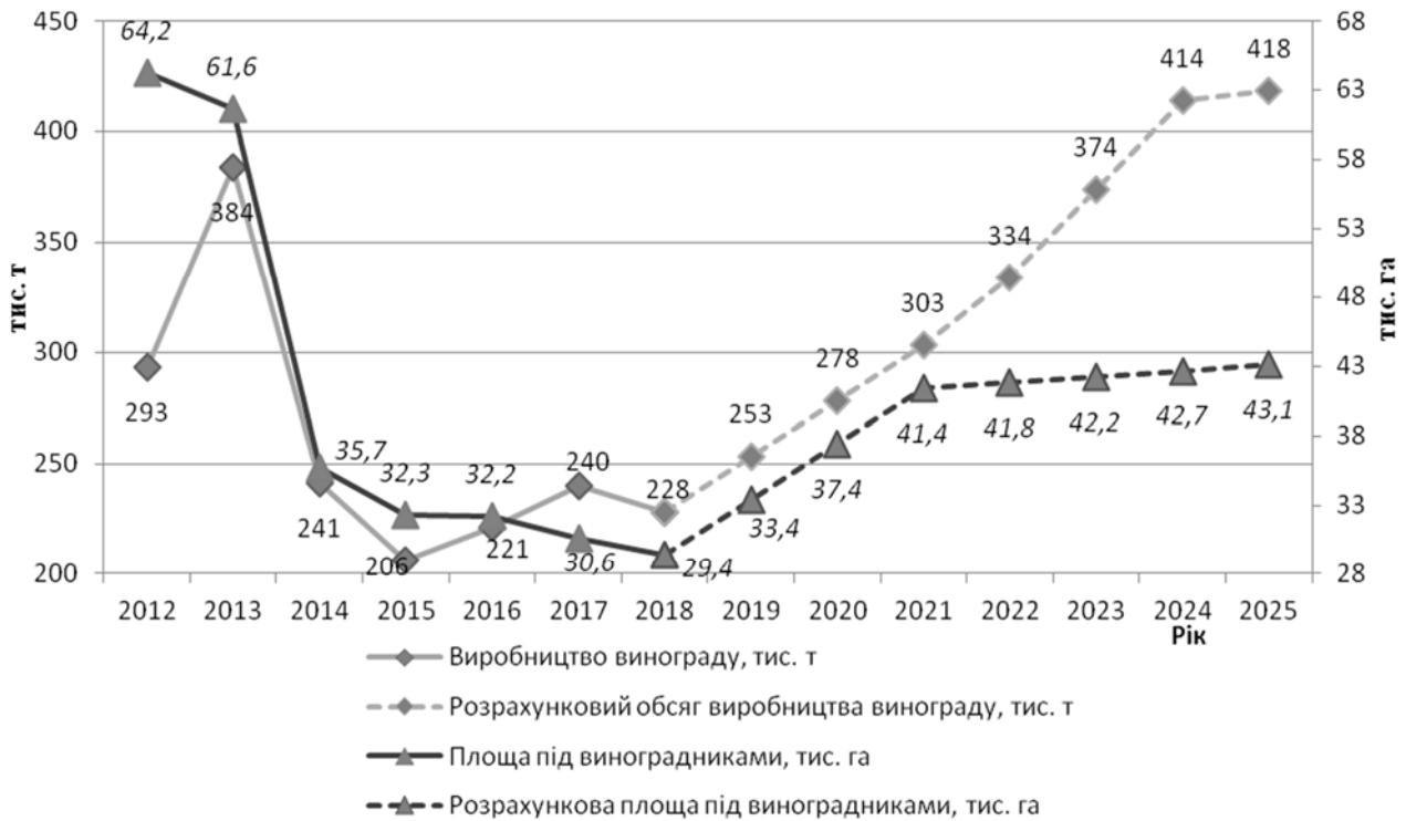
Рис. 2. Розвиток виробництва винограду в сільськогосподарських підприємствах України на перспективу