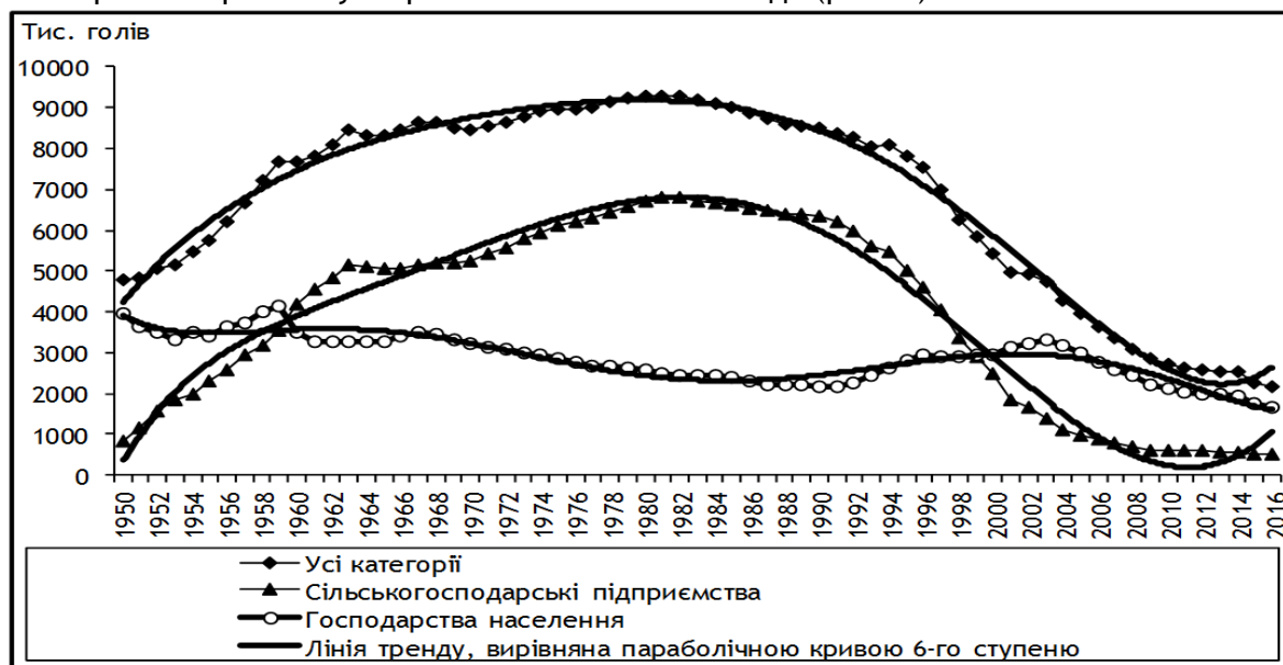
Рис. 1. Динаміка поголів'я корів у сільському господарстві України*

Динаміка поголів'я корів у сільському господарстві України характеризується періодами збільшення (1950-1981 рр.) і зменшення (1981-2016 рр.) численності продуктивного стада (рис. 1).