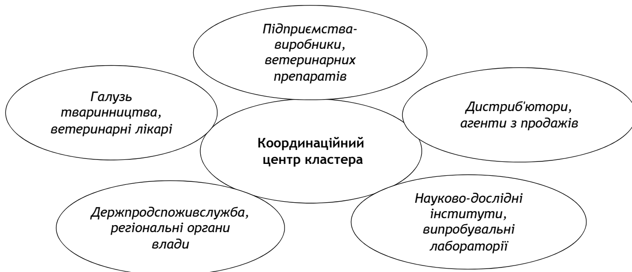
Рис. 3. Модель кластера в галузі ветеринарної фармації