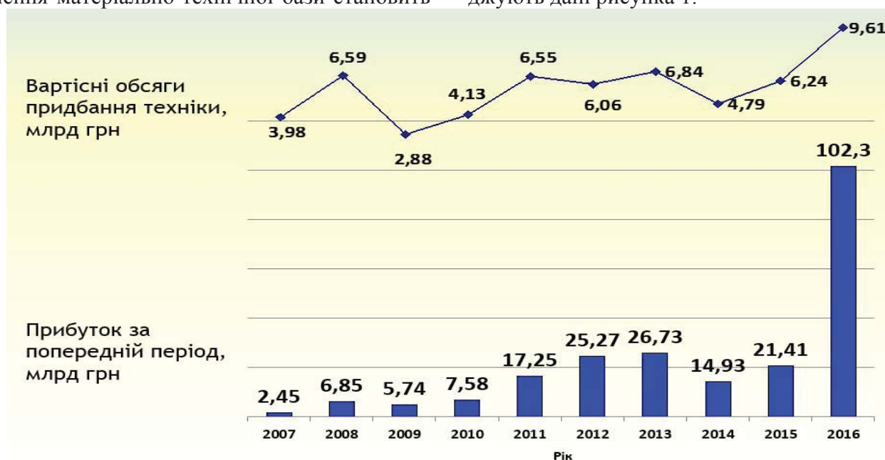
Рис. 1. Вплив фінансових результатів підприємств галузі сільського господарства на обсяги придбання сільськогосподарської техніки

прибуток. У ринкових умовах роль прибутку незмірно зростає, забезпечуючи підвищення рівня конкурентоспроможності підприємства спрямуванням прибутку на заходи з посилення сильних конкурентних елементів та усунення слабких сторін. У тому випадку, коли рівень фондооснащеності сільськогосподарських угідь і фондоозброєності праці гальмує випуск конкурентоспроможної продукції, прибуток має направлятися на розвиток матеріально-технічної бази підприємства. Значимість прибутковості сільськогосподарської діяльності в техніко-технологічному оновленні галузі підтверджують дані рисунка 1.