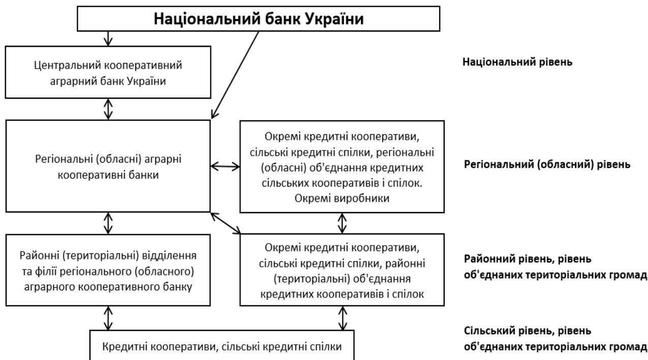
Рис. 3. Перспективна кооперативно-кредитна система банківського обслуговування аграрного сектору України

Досвід інших країн та розробки багатьох вітчизняних вчених дозволяють пропонувати принципову схему розбудови системи кредитного забезпечення аграрного сектору України на кооперативних засадах (рис. 3).