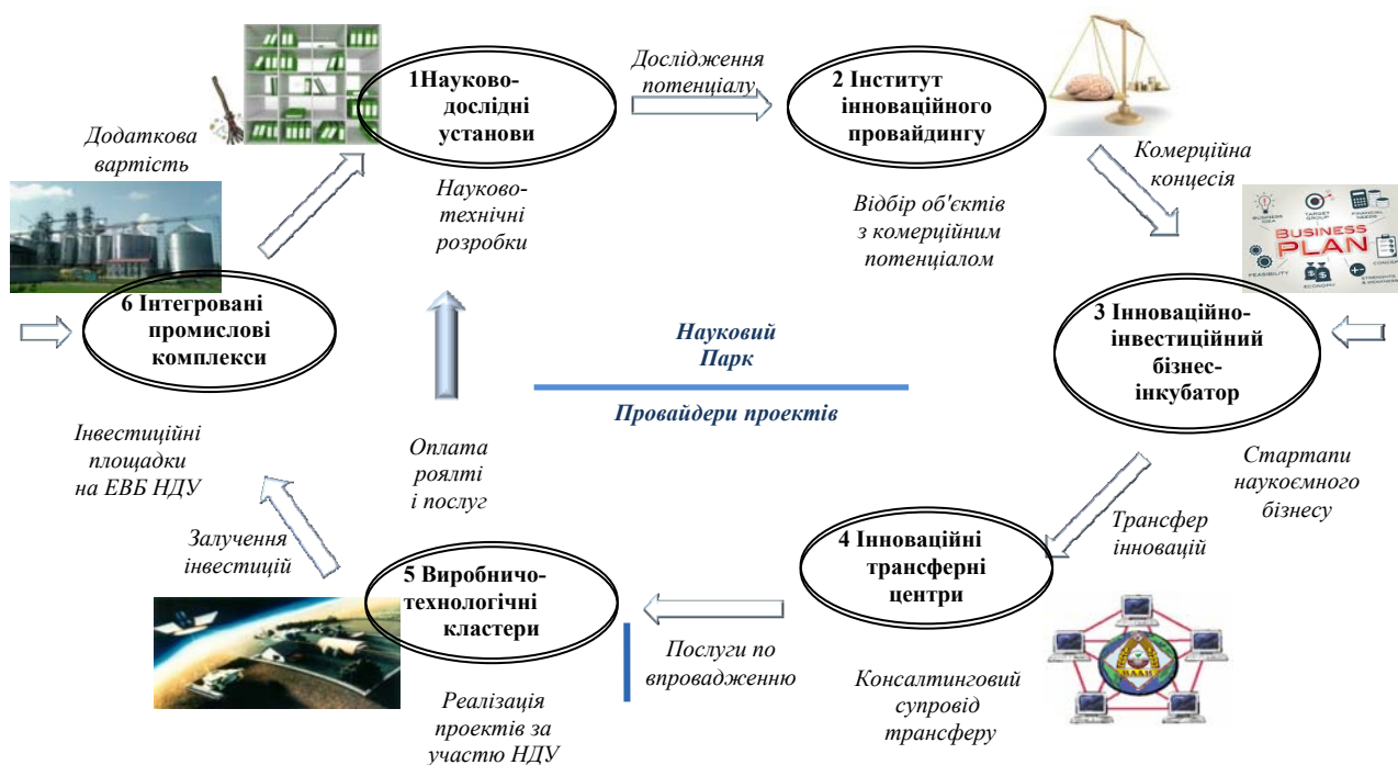
Рис. 3 Алгоритм реалізації проектів

лексу, що забезпечує нарощування виробничих потужностей науково-виробничих кластерів і одержання додаткової вартості від реалізації кластерної продукції