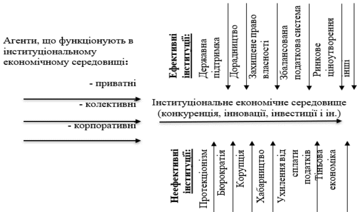
Рис. 1. Формування інституціонального економічного середовища