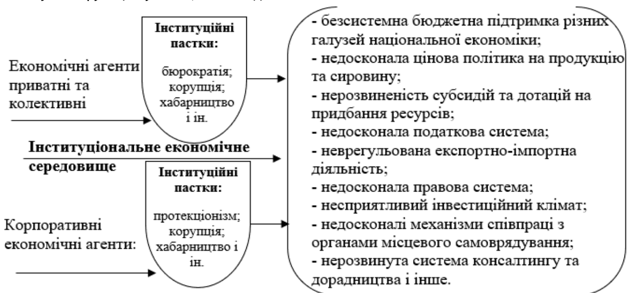
Рис. 2. Вплив фундаментальних проблем та інституційних пасток на сучасний стан інституціонального економічного середовища

Удосконалення ефективності діючого інституціонального середовища відбувається за рахунок введення нових інститутів та інституцій, які будуть вносити запропоновані зміни. Відстеження самих змін у функціонуючому інституціональному економічному середовищі можливо за допомогою підходів, запропонованих у теорії залежності від попереднього розвитку. Науковці, що вивчають теорію «залежності від попереднього розвитку», зазначають, що «попередній розвиток» - це послідовність зроблених кроків в процесі вирішення проблеми [19-25].