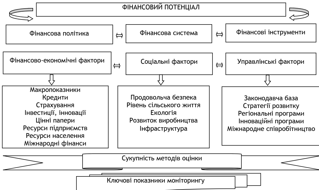
Рис. 2. Складові механізму формування та використання фінансового потенціалу аграрного сектору для сталого розвитку

Формування механізму управління фінансовим потенціалом сталого розвитку включає в себе вибір такої фінансової політики, за якої при оптимальній взаємодії складових потенціалу загальний досягне найвищого рівня. Власне механізм управління потенціалом формується під впливом трьох груп факторів: фінансово-економічних, соціальних та управлінських (рис. 2).