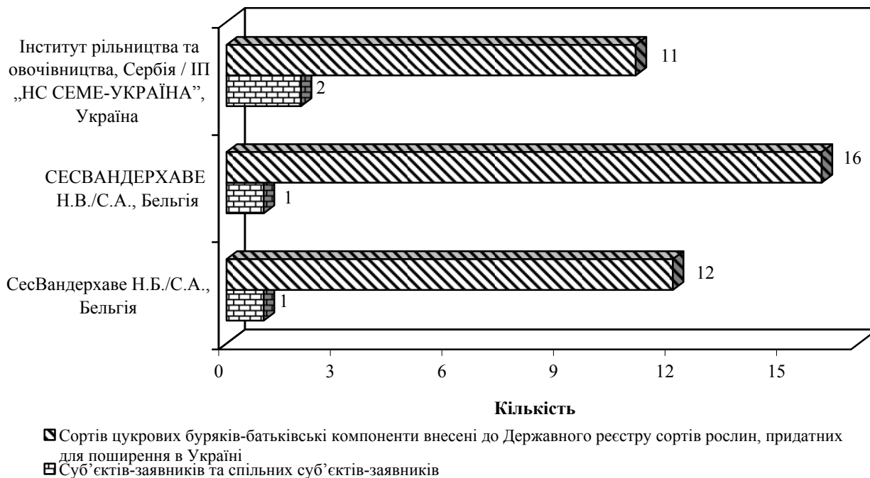
Рис. 1. Кількість суб'єктів-заявників та сортів цукрових буряків-батьківські компоненти селекції країн, внесених до Державного реєстру сортів рослин, придатних для поширення в Україні, 2011-2014 рр.

жба України з питань безпечності харчових продуктів та захисту споживачів (постанова КМУ № 442 від 10 вересня 2014 року „Про оптимізацію системи центральних органів виконавчої влади”). При цьому чи визначені чітко функції цієї служби, дотепер невідомо.