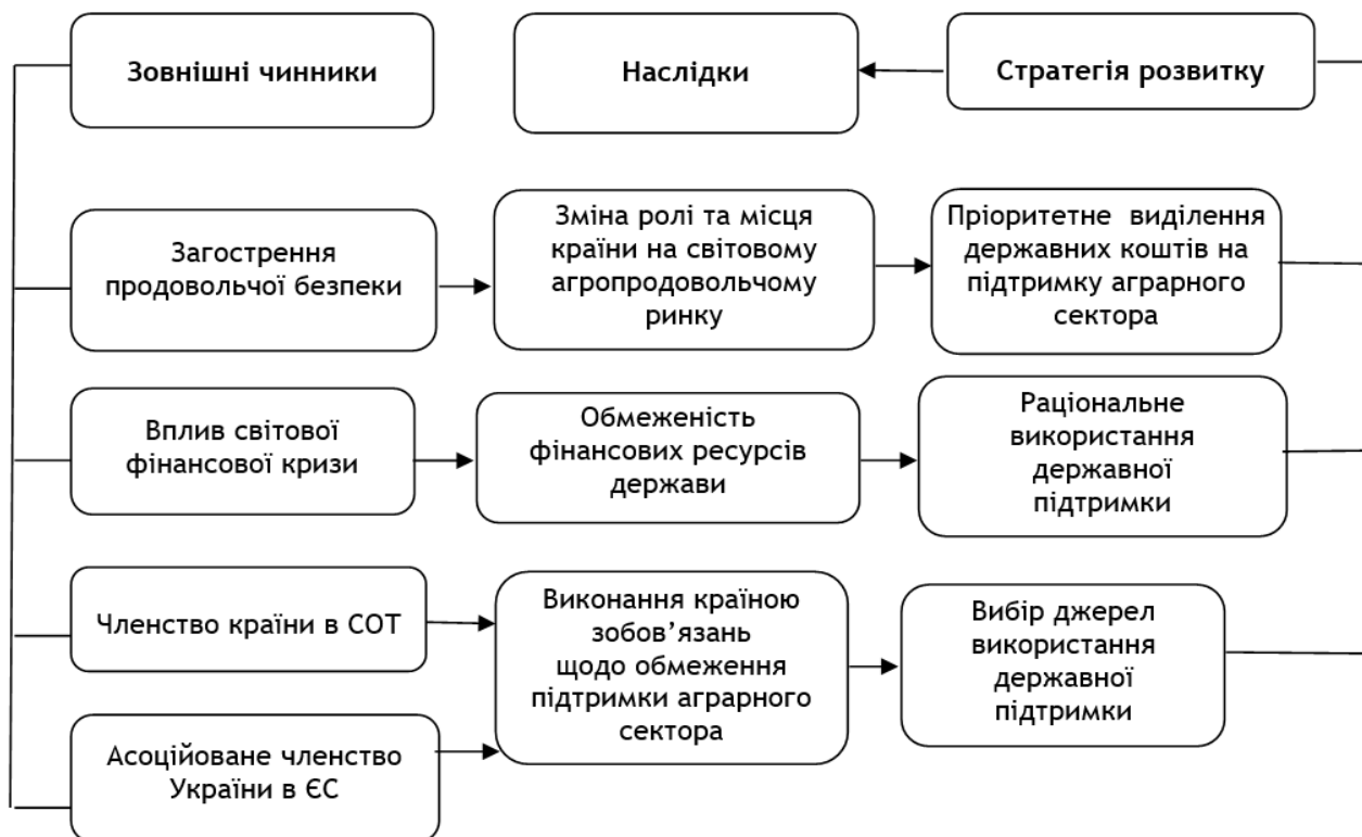
Рис. 3. Схема стратегії розвитку державної підтримки аграрного сектору

розробки стратегії розвитку державної підтримки національного аграрного сектору слід повною мірою враховувати вплив зовнішніх чинників та їхні наслідки, як-то відображено на відповідній схемі (рис. 3).