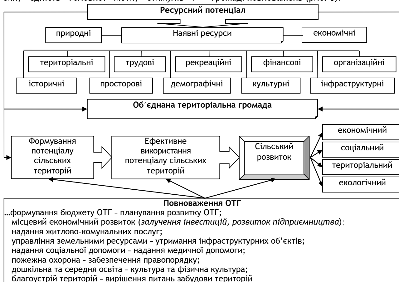
Рис. 3. Потенціал розвитку сільських територій

З огляду на пріоритетність економічної ролі сільської територіальної громади базисом сільського розвитку стає наявний у неї ресурсний потенціал, ефективне використання якого забезпечує виконання наданих громаді повноважень (рис. 3).