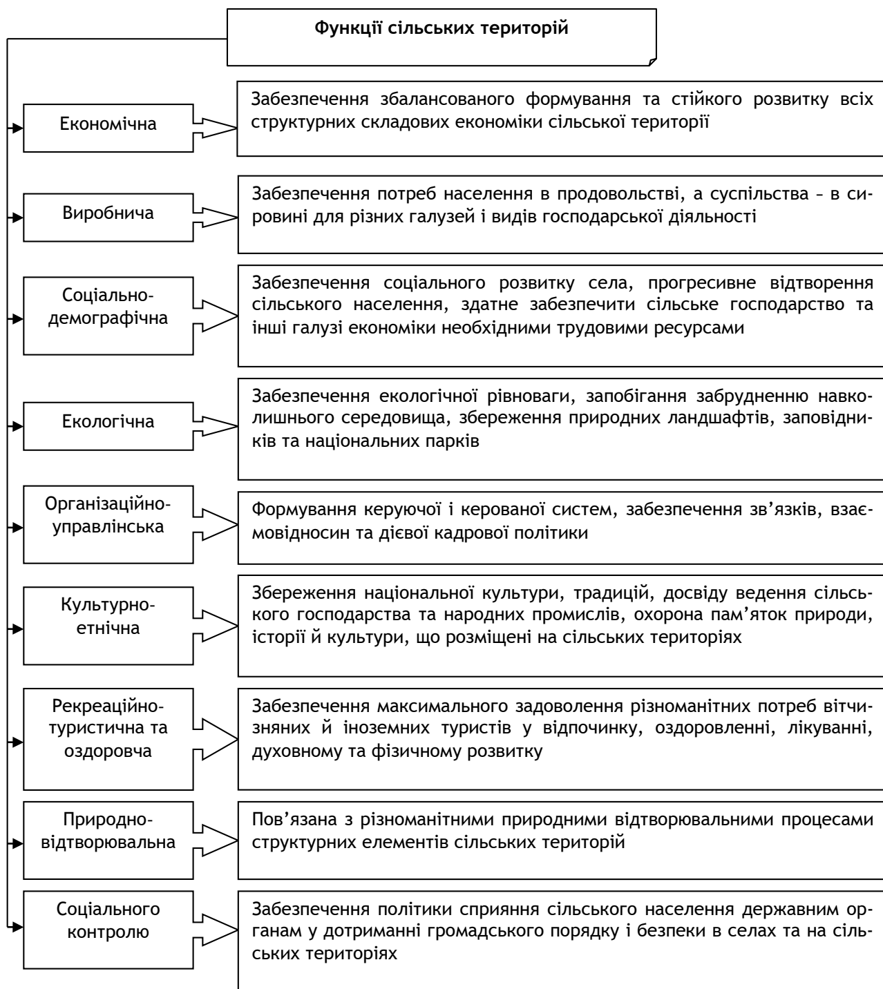
Рис. 1. Основні функції сільських територій

Серед основних функцій сільських територій виділяють економічну, виробничу, соціально-демографічну, організаційно-управлінську, екологічну, культурно-етнічну, рекреаційно-туристичну та оздоровчу, природно-відтворювальну, соціального контролю над територією (рис. 1).