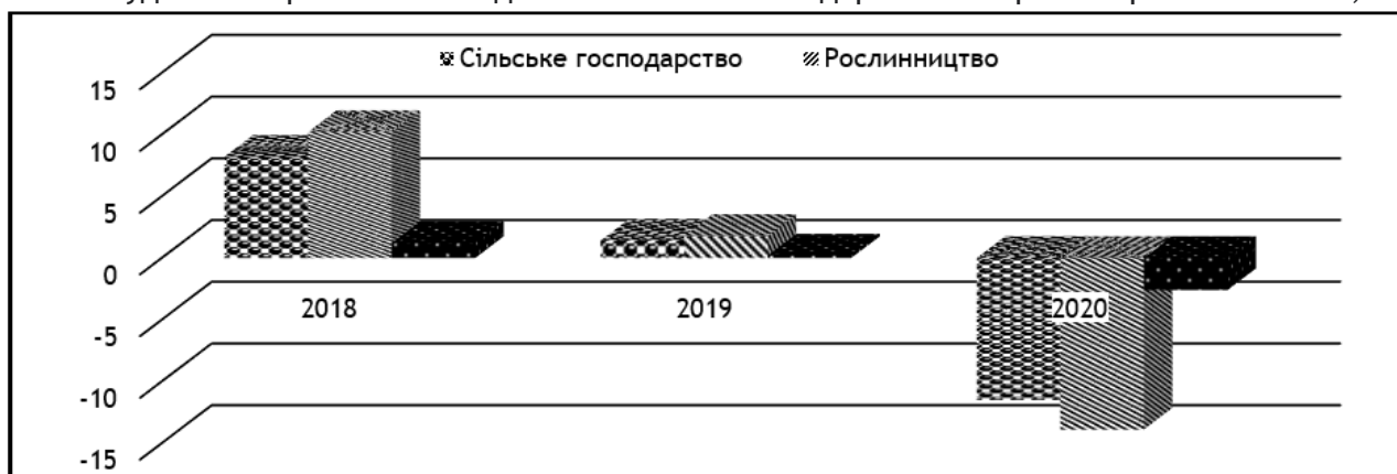
Рис. 2. Обсяги виробництва сільськогосподарської продукції, %

01.01.2020 р. скоротилося на -6,2%, птиці на -9,3%, свиней зросло на +2% [19]. У 2020 р. загальні обсяги реалізації на забій сільськогосподарських тварин скоротилися на -1,1%.