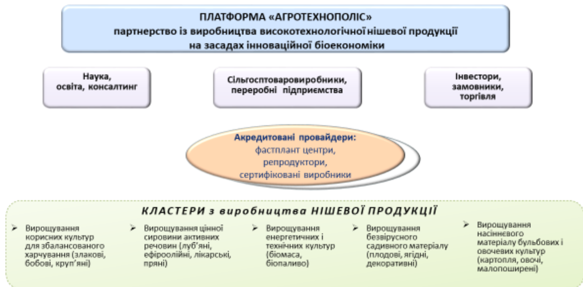
Рис. 4. Модель впровадження фастплант-технології