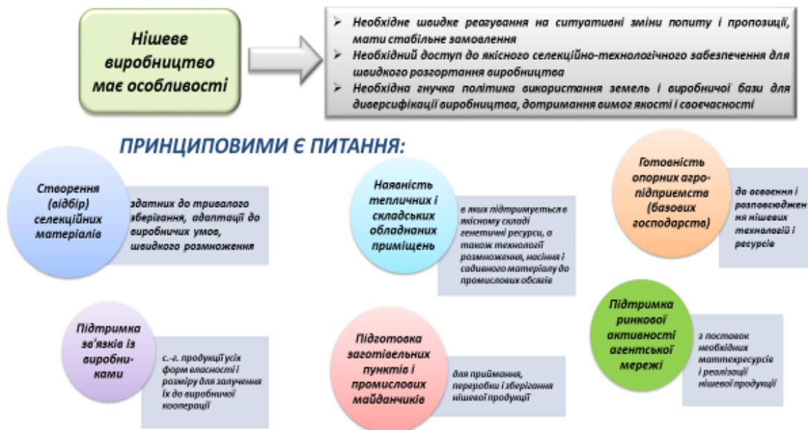
Рис. 2. База виробництва нішевих культур

біоекономіки. Для аграрної науки характерний потужний науковий потенціал для забезпечення виробництва нішевої продукції, оскільки: завдання наукових досліджень НДУ НААН спрямовані на створення селекційних матеріалів практично по всьому спектру нішевих культур; освоюються сучасні технології насінництва і вирощування нішевих культур, у тому числі органічного виробництва; виробляються окремі види насінневого і садивного матеріалу на замовлення виробників нішевої продукції (рис. 2).