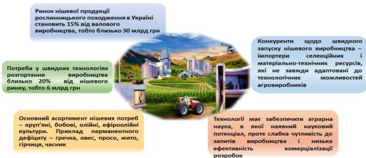
Рис. 1. Ринкові тенденції виробництва нішевих культур