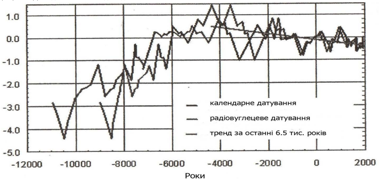
Рис. 2. Історія температури Північної півкулі в голоцені за 12 тис. років