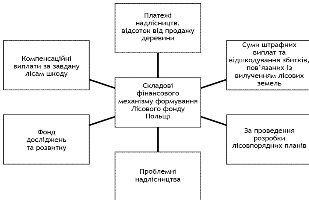
Рис. 1. Складові фінансового механізму формування Лісового фонду Польщі відповідно до Польського Закону про ліси

6) інші доходи, отримані для зазначеного Фонду.