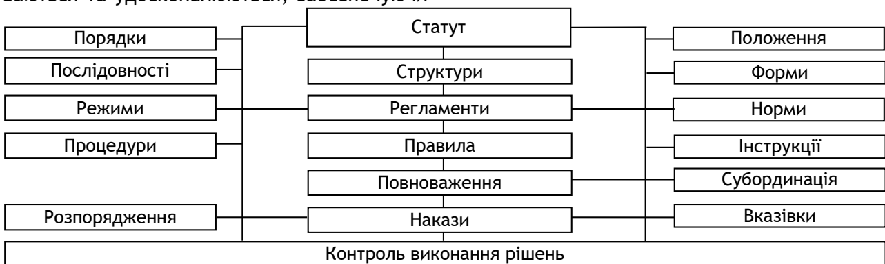
Рис. 2. Послідовність розробки і впровадження головних інструментів адміністрування

нові підходи до реалізації всезростаючих потреб організації і потенціалу її персоналу [6]. Це зумовлює необхідність визначеності, чіткості та, головне, однозначності стосовно розуміння застосування навіть самих звичайних й постійно практикуючих форм адміністрування.