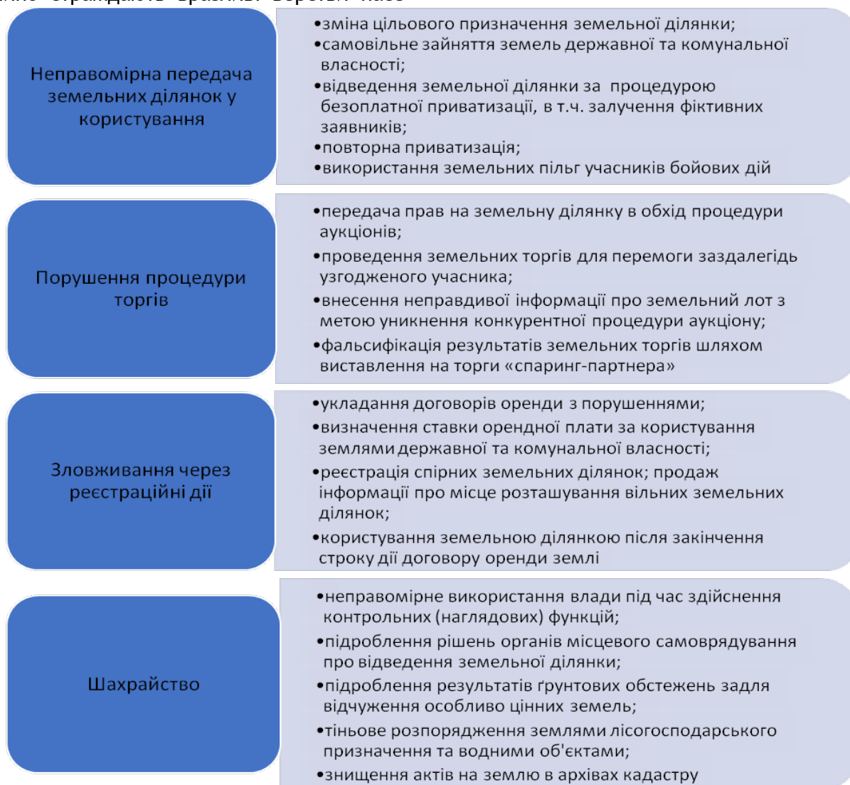
Рис. 1. Види корупційних дій у сфері сільськогосподарського землекористування

В Україні найпоширенішими тіншовими схемами правопорушень у сфері сільськогосподарського землекористування визнано: неправомірна передача земельних ділянок у користування, порушення процедури торгів, зловживання через реєстраційні дії, шахрайство (рис. 1). Крім наведених варіантів також мають місце зловживання під час видачі сертифікатів інженерів-землевпорядників, конфлікт інтересів при вчиненні землевпорядних дій тощо.