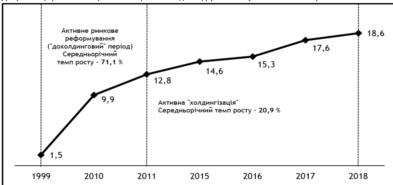
Рис. 2. Динаміка обсягів експорту сільськогосподарської продукції і продовольчих товарів за 2000-2018 рр., млрд дол. США

Джерело: Сформовано авторами із використанням даних Державної служби статистики України.