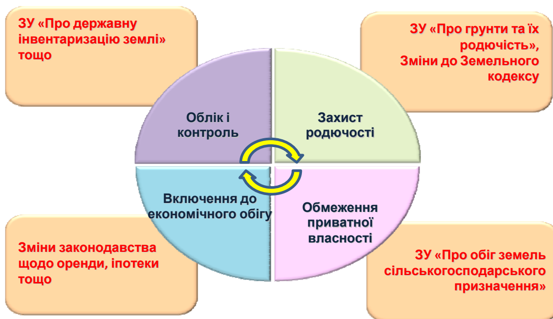
Рис. 1. Національно-селянський вектор земельної реформи

У результаті фундаментальних досліджень, співпраці з комісіями при Комітетах Верховної Ради України, Мінагрополітики України у Відділенні сформовано ідеологію національно-селянського вектора земельної реформи (рис. 1).