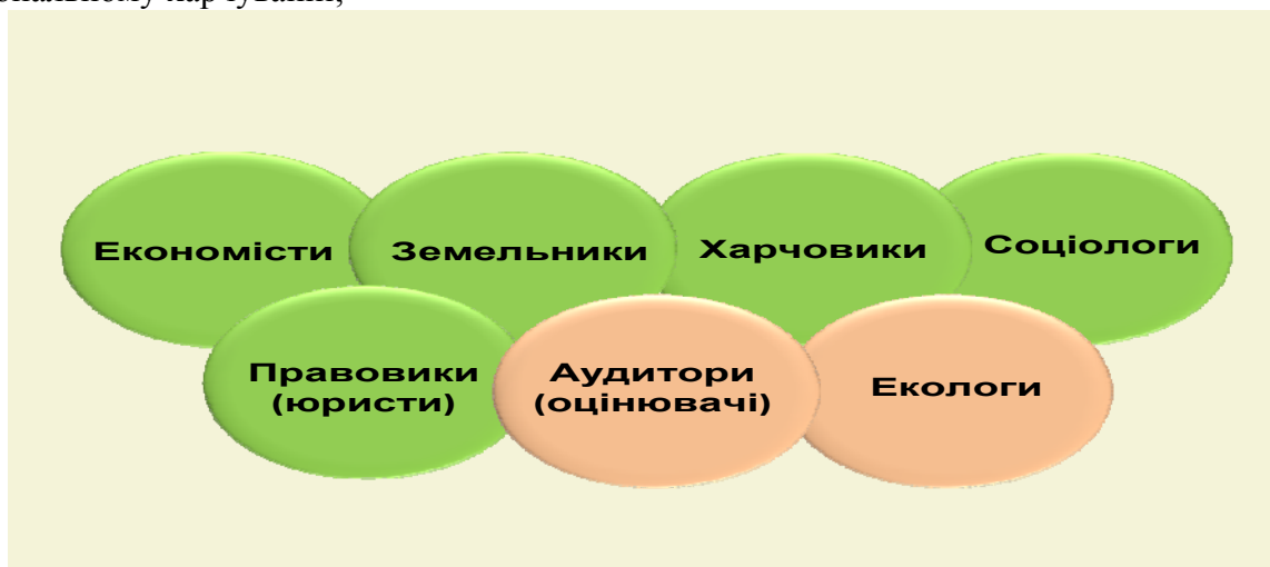
Рис. 4. Стратегія розвитку наукового потенціалу Відділення аграрної економіки і продовольства (етап 2014 року)

Все це вимагає посиленої уваги до розвитку кадрового потенціалу. Стратегія формування наукової спеціалізації фахівців Відділення на 2014 рік представлена на рисунку 4.