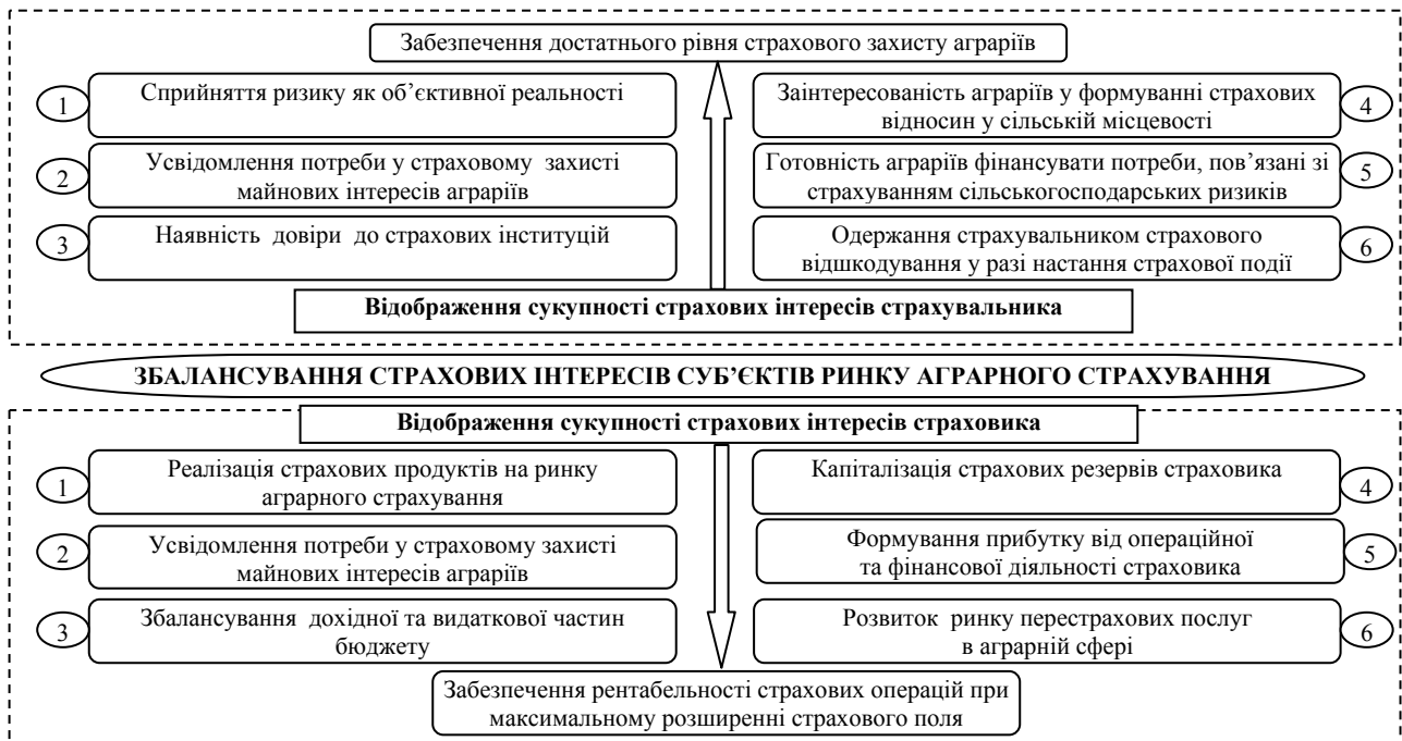
Рис. 2. Сукупність страхових інтересів учасників ринку аграрного страхування

та здійснення витрат за результатами операційної й фінансової діяльності, використання сучасних маркетингових технологій на страховому ринку та оптимізація бізнес-процесів страховика) і стратегічних (розширення страхового поля страховика й підвищення його конкурентоспроможності на ринку, а також адаптації його діяльності до вимог загальноєвропейського страхового простору) завдань розвитку страхового бізнесу. Зіставлення страхових інтересів страхувальників та страховиків створює необхідну основу для розвитку попиту і пропозиції на страховому ринку (рис. 2).