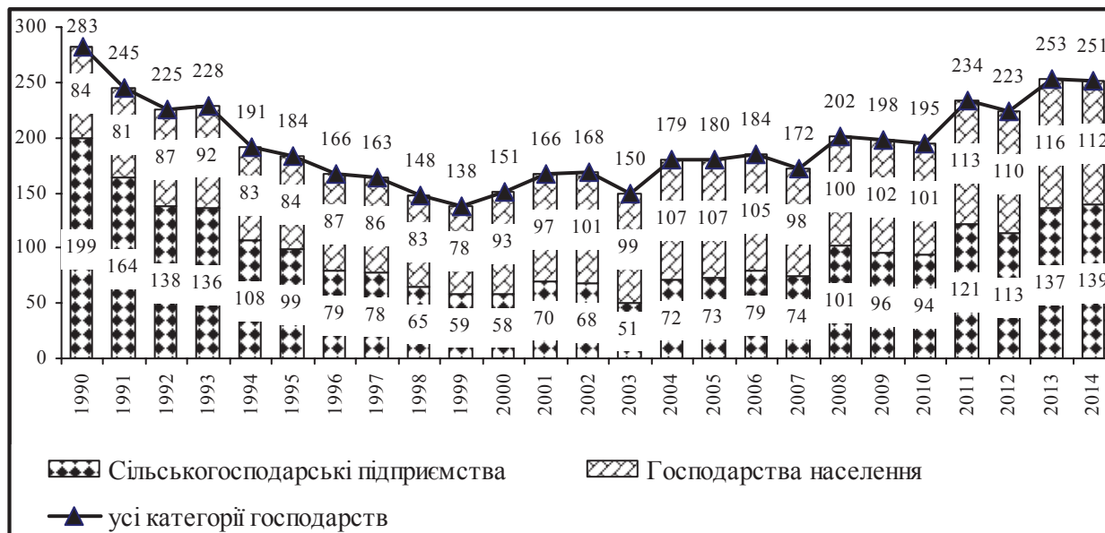
Рис. 2. Динаміка виробництва валової продукції сільського господарства за категоріями господарств, млрд грн

Сталися зміни у виробництві в сільськогосподарських підприємствах і господарствах населення (рис. 2).