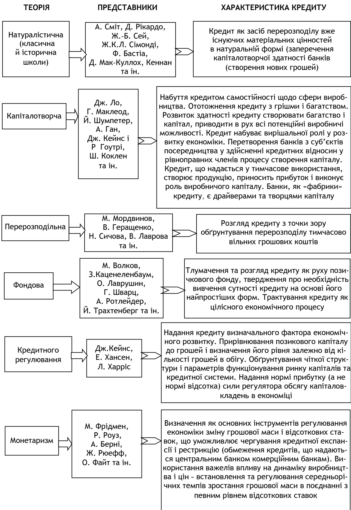
Рис. 1. Теоретична структуризація трактування сутності кредиту