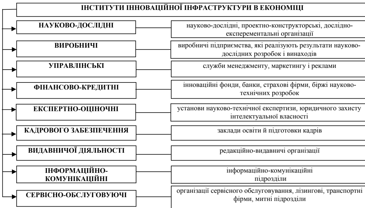
Рис. 1. Об'єкти інфраструктурного забезпечення формування інтелектуального капіталу і розвитку-поширення інновацій в національній економіці*

*Джерело: сформовано на основі нормативних документів і опрацьованої літератури.