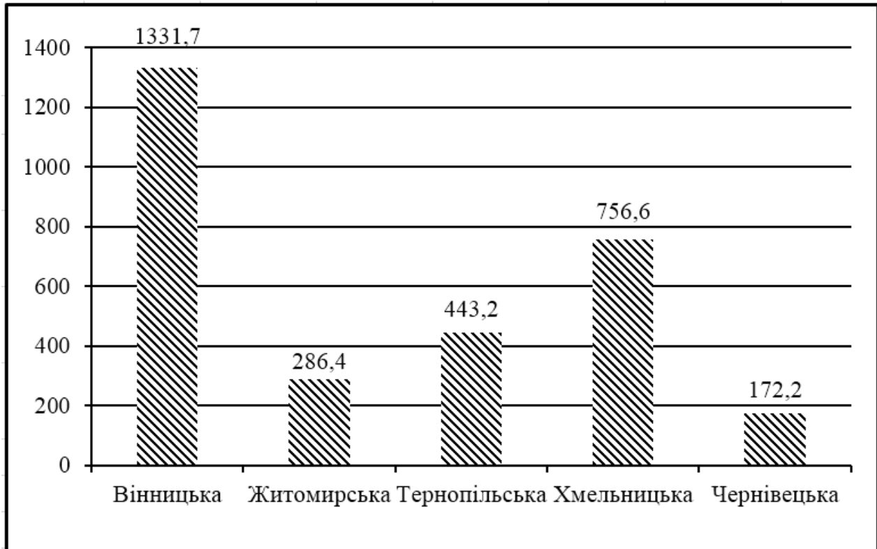
Рис. 1. Обсяг виробництва сільськогосподарської продукції фермерських господарств деяких областей у постійних цінах, млн грн

масштаби реалізації сільгосппродукції порівняно з сусідніми областями (рис. 1).