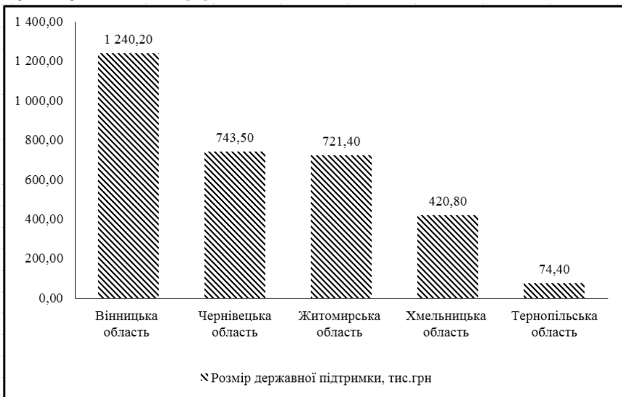
Рис. 3. Надання кредитів фермерським господарствам