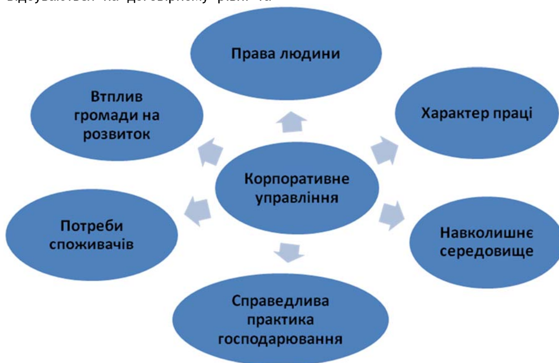
Рис. 2. Сфери КСВ - ISO 26000: основні напрями

регламентовані угодами, положеннями про діяльність структурних підрозділів та іншими непопулярними діями. Мотивація соціальної відповідальності в сучасних аграрних бізнес-структурах, за досвідом європейських країн, має враховувати актуальні тенденції, які формуються на засадах сталого розвитку і викликів глобалізації.