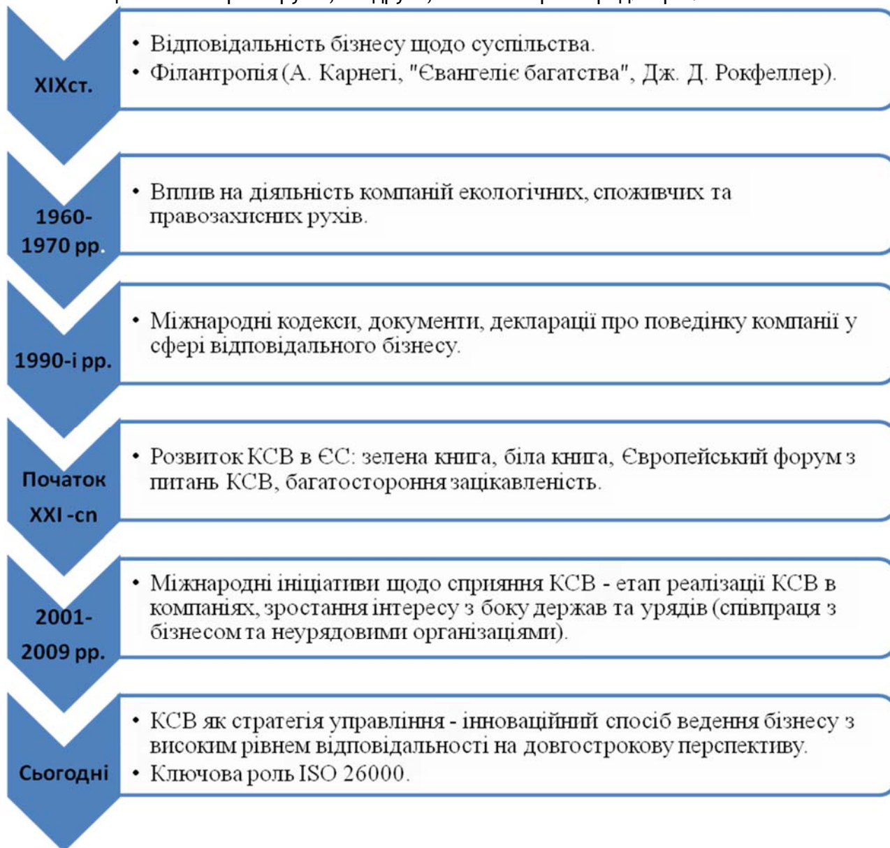
Рис. 1. Еволюція формування КСВ

на результати ефективної боротьби зі змінами клімату й розв'язання соціальних проблем, які можуть стати активом для компанії, привабливим додатковим продуктом для інвесторів і кредиторів.