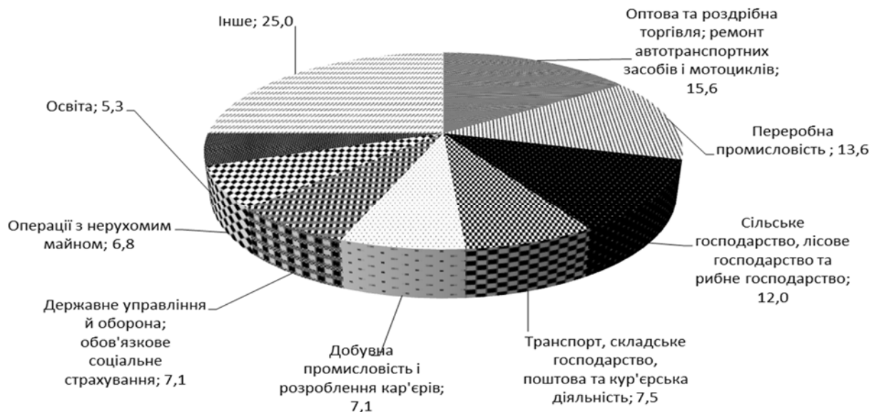
Рис. 1. Структура валової доданої вартості за видами економічної діяльності у 2018 р., %

Разом із тим на сьогодні двома найперспективнішими (як мінімум у суспільній свідомості) галузями вітчизняної економіки визначено сільське господарство та ІТ. Однак це абсолютно бізнес-протилежності, які перебувають на різних полюсах технологічного прогресу: існуюча в онлайн індустрія і максимально приземлена робота, прив'язана до місця й часу [13]. Однак «приземленість» сільського господарства не заважає йому генерувати 12% ВДВ (рис. 1).