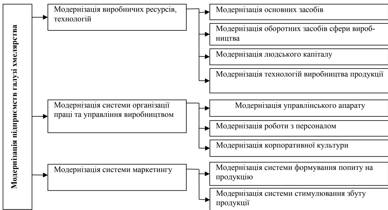
Рис. 6. Стратегічні й тактичні цілі модернізації хмелярських підприємств

Реалізація місії модернізації підприємств галузі хмелярства передбачає досягнення ряду стратегічних і тактичних цілей (рис. 6).