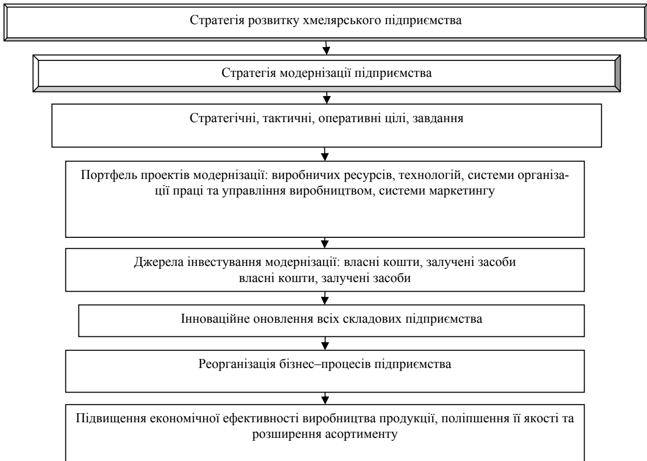
Рис. 1. Концептуальна модель розвитку модернізації хмелярських підприємств