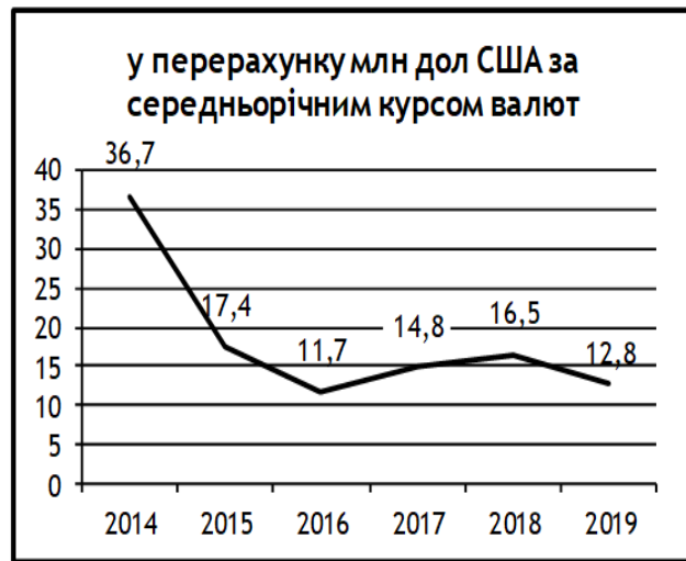
Рис. 2. Динаміка фінансування НААН за рахунок загального фонду Державного бюджету України, грн і дол. США, у перерахунку за середньорічним курсом валют