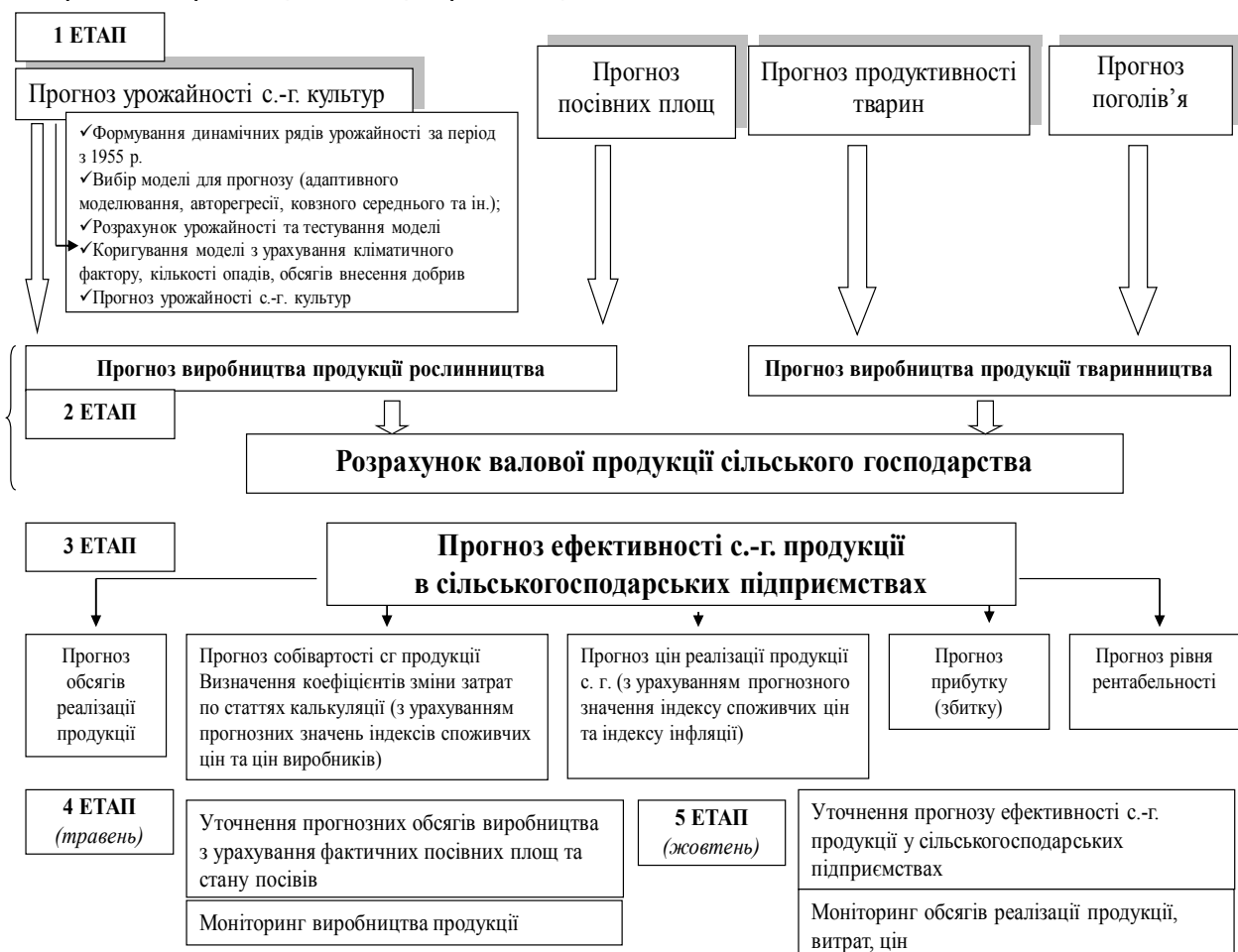
Рис. 1. Модель (алгоритм) прогнозування обсягів та ефективності с.-г. виробництва

четвертий етап включає уточнення прогнозних показників у процесі моніторингу виробництва, після завершення посівних робіт. Він виконується щодо обсягів виробництва продукції з урахуванням фактичних посівних площ та стану посівів [5]. П'ятий етап також є уточнюючим стосовно раніше прогнозованої ефективності виробництва в сільськогосподарських підприємствах на основі даних моніторингу обсягів реалізації продукції, витрат та цін на неї [6].