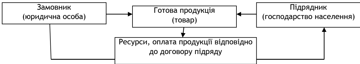
Рис. 1. Концептуальна модель залучення господарств населення до інтегрованих відносин в аграрному секторі економіки на засадах підряду