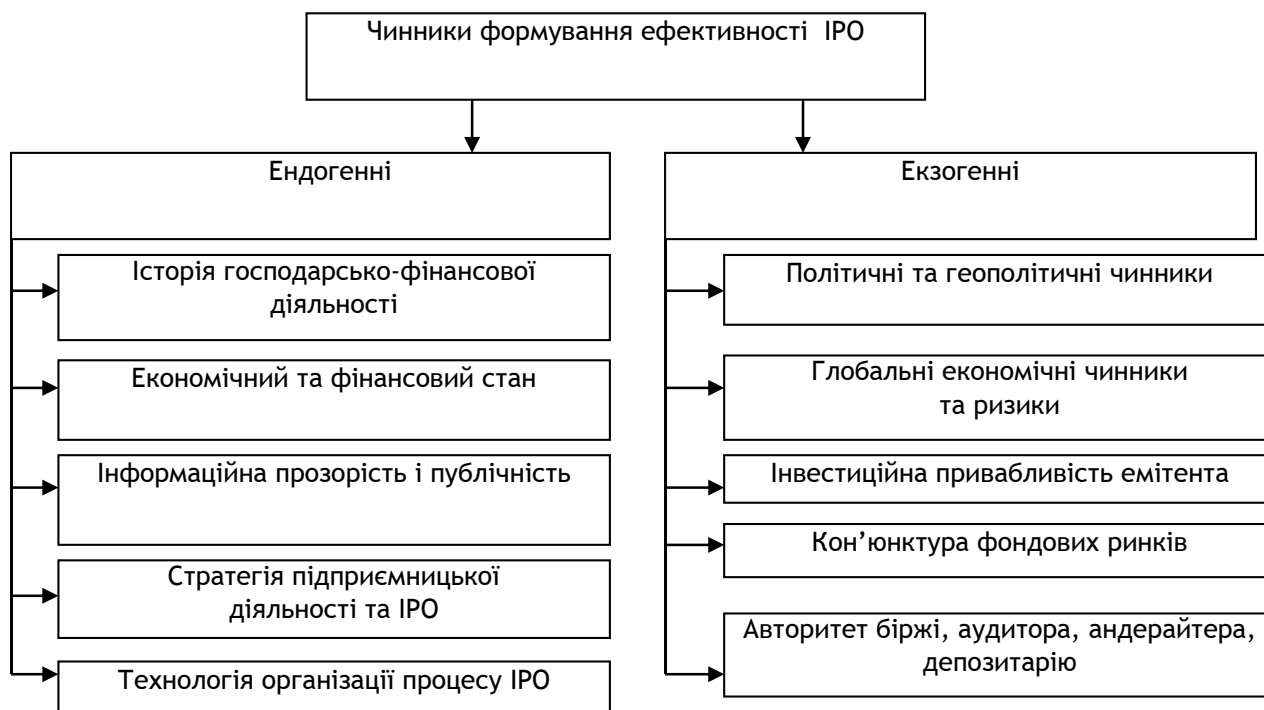
Рис. 3. Чинники формування ефективності діяльності інтегрованих суб'єктів господарювання на міжнародних ринках капіталів

На ефективність діяльності інтегрованих суб'єктів господарювання на міжнародних ринках капіталу впливає низка загальних і специфічних ендогенних і екзогенних чинників, що перебувають у тісному взаємозв'язку, визначаючи кінцевий результат (рис. 3).